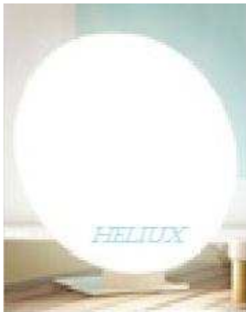
Lampe de la société CONFORAMED